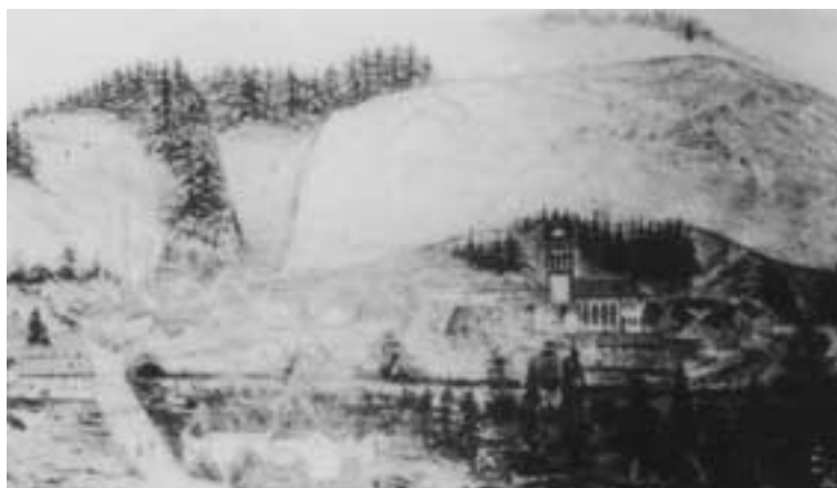
Kirschseiffen nach einer Zeichnung von Eugen Virmond um 1880

Zur evangelischen Gemeinde zu Kirschseiffen gehören die Evangelischen (Lutheraner) von Kirschseiffen, Hellenthal und Blumenthal. In dieser ganz evangel. Gemeinde starben im Totenjahr 1890/91, also v. November 1890 bis November 1891 nur zwei Personen (ein Kind, ein Erwachsener). Die Reformierten dieser Orte (also die Anhänger Calvins) hatten ihre Kirche u. Gemeinde zu Gemünd, hielten sich dahin u. lebten lange Jahre mit den Lutheranern in der heftigsten Feindschaft. Im J. 1839 mußten alle Reformierten, die nach dem Jahre 1822 konfirmiert worden waren, der evangel. Gemeinde zu Kirsch-