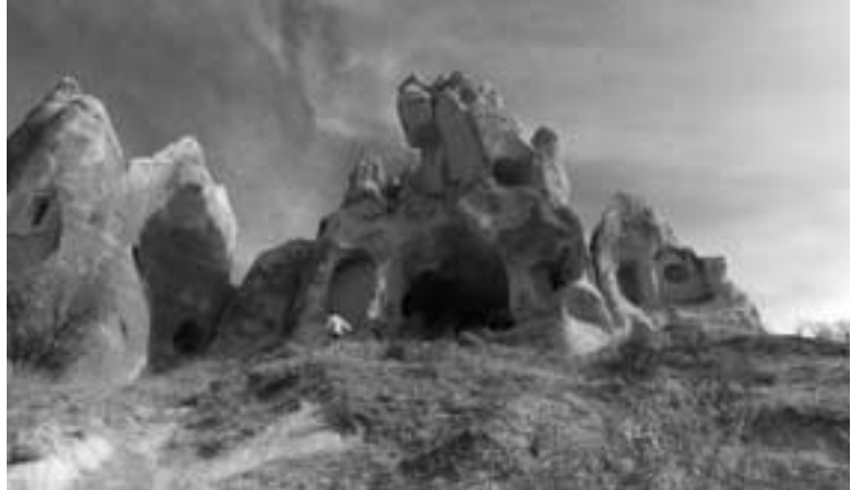
OG Brühl. Fern der Heimat: Die bizarren Tuffstein- formationen der Türkei.

Zeit. Selbstverständlich war auch die Zeit vorhanden zur Besichtigung des Mausoleums von Atatürk.