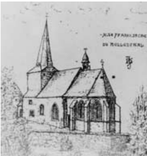
Alte Pfarrkirche Hellenthal nach einer Zeichnung von Jos. Heinen (1904)

Die Kapelle lag auf Schleidener Höhe, die bevölkerungsmäßig und wirtschaftlich den bedeutenderen Teil des geteilten Ortes ausmachte. Wenn wir Kapelle sagen, meinen wir natürlich die kleine Kirche, die unweit der ehemaligen Eisenhütte, im Talgrund, in der damaligen Ortsmitte, errichtet wurde. Wir nennen das Gotteshaus Kapelle, weil die Gemeinde keine Pfarrechte besaß – und über mehrere Jahrhunderte auch nicht erlangen sollte. Ob die Untertanen zu ihrem Bau aus eigenen Mitteln in der Lage waren, mag füglich bezweifelt werden; vermutlich hat die Herrschaft das Vorhaben unterstützt. – Im