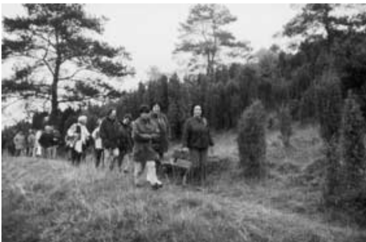
Blankenheim. Wandern im Wacholdernaturschutzgebiet Lampertstal ist ein ganz besonderes Erlebnis.

Der 20-minütige Videofilm „Täler ohne Grenzen“ eignet sich z.B. hervorragend zur Auflockerung von Mitgliederversammlungen und kann gegen einen Unkostenbeitrag von 15,00 € (inkl. Versandkosten) bezogen werden beim Verein Naturpark Hohes Venn – Eifel im Deutsch-Belgischen Natur park, Geschäftsstelle, Steinfelder Straße 8, D-53947 Nettersheim, info@naturpark-hohesvenn-eifel.de