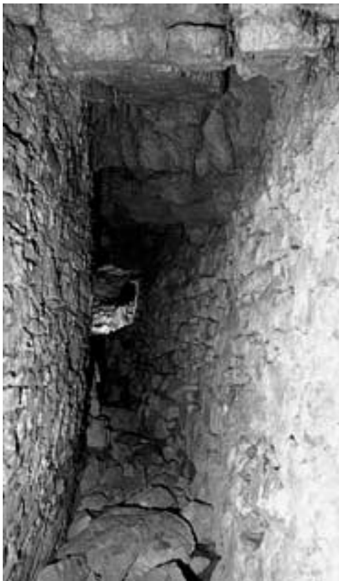
Blankenheim. Blick in den Tiergarten-Tunnel.