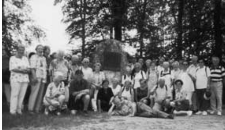
OG Wittlich. Gut gelaunt erreichten unsere Wittlicher Eifelreunde die Mitte von Bayern.

Dann stand die erste Schiffahrt auf der Donau an, von Kelheim durch die „Weltenburger Enge“ zu der Klosterkirche der Benediktiner abtei Weltenburg mit der bekanntlich ältesten Klosterbrauerei. Am Nachmittag fuhren wir mit dem Bus zum Limes, zur Hadriansäule am Ende der rätischen Mauer an der Donau.