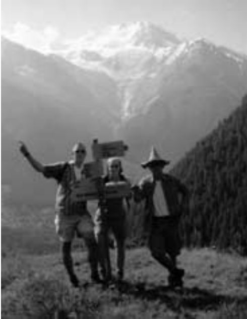
OG Heimbach. „Uns ist kein Aufstieg zu steil“.

baden mit gigantischem Blick auf das Matterhorn einlud. Am nächsten Morgen machten wir uns auf den Weg hinunter von der Fluhalp bis zur Sunegga (2088 m). Dort angekommen fuhren wir mit der Bahn hinunter nach Zermatt (1616 m) und per Bus schließlich nach Grächen zurück.