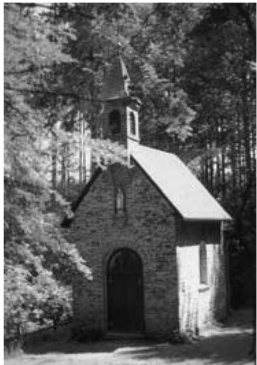
Waldkapelle, erbaut zum Gedenken des Grafen Eduard de Brier

belgischen Nachbargemeinde und zum Königreich. Doch diese Grenze war schon zu einer Zeit durchlässig, als anderorts der Traum vom vereinten Europa noch tief schlummerte. Dank der Aktivitäten des Eifelvereins Helleenthal liefen schon in den 50er und 60er Jahren des vorigen Jahrhunderts die