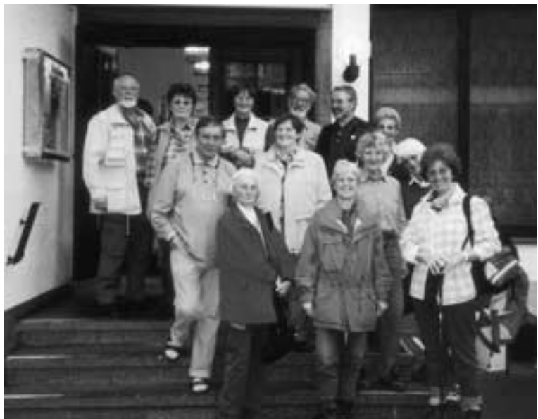
OG Frechen. Ohne Gepäck lässt's sich im Monschauer Land gut wandern.

Nach ausgedehnter Pause machten wir uns wieder auf den Weg. Über kleine Geröllfelder, abschüssige Wegpassagen und einen steilen Zick-Zack-Weg erreichten wir die Fluhalp (2610 m), die mit ihrer großen Sonnenterasse zum nachmittäglichen Sonnen-