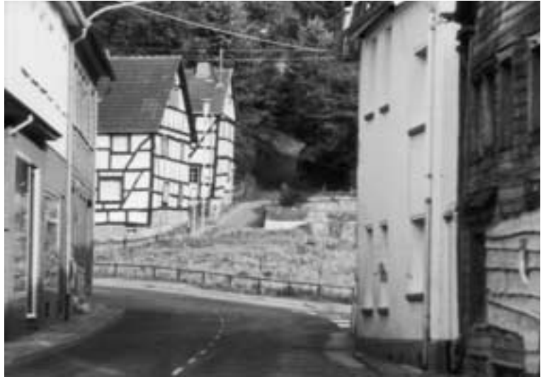
Fachwerkhäuser in der Ackergasse

der Badebütt gewesen! Das häusliche Donnerwetter klingt mir heute noch in den Ohren.“