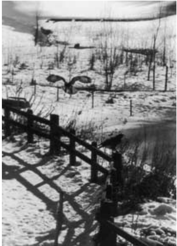
Schilsbachtal. Auch sie warten auf das Futterstück: Die Mäusebussarde sind regelmäßige Gäste im Naturparadies von Jöb Kersting.

Unter diesen Umständen rücken Buntsprecht, Haubenmeise, Baumläufer und Kleiber, die in Scharen