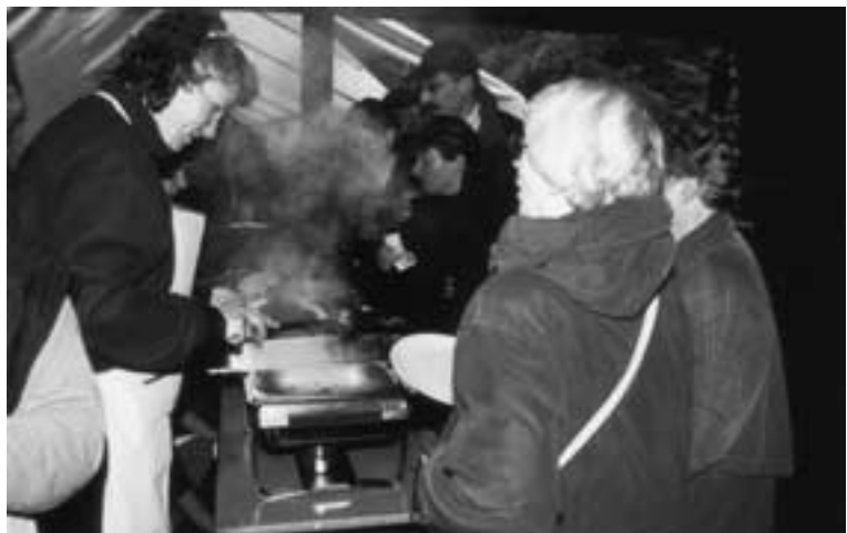
OG Ulmen. Es ist noch Blutwurst da..