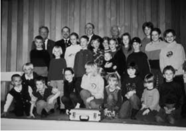
OG Eschweiler. Hier braucht sich die Vereinsführung keine Sorgen um den Nachwuchs zu machen.