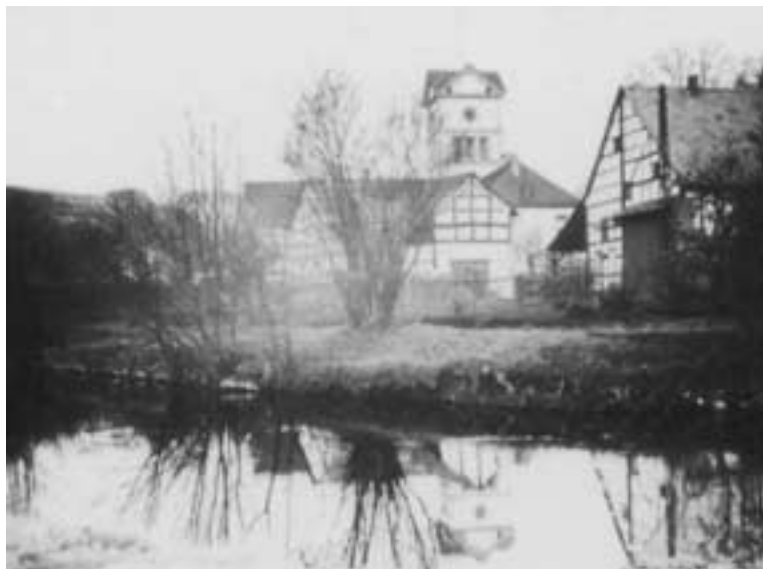
Kirschseiffen mit dem klassizistischen Kirchthum (1930)