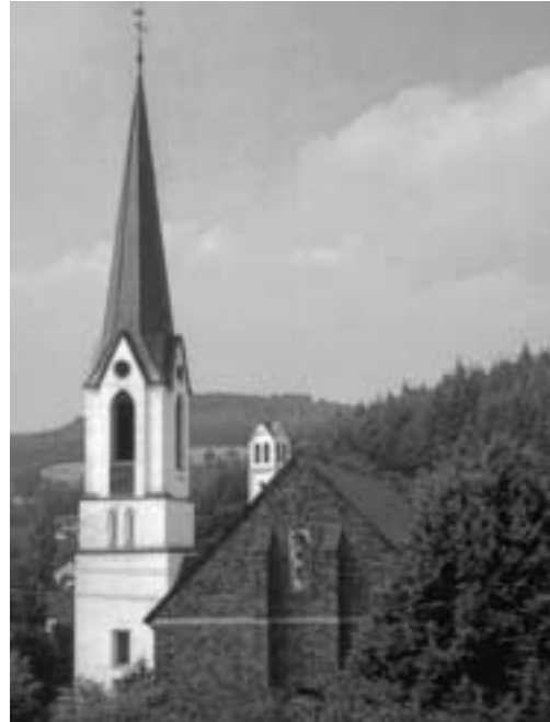
Neue Pfarrkirche Hellenthal

Das Bestreben der Herren von der Mark, das katholische Bekenntnis in ihrer Herrschaft zu festigen, fand seinen sichtbaren Niederschlag in der Gründung einer Niederlassung von Franziskaner-Mönchen in Schleiden (1642). Die Bemühungen um Erneuerung und Stärkung der katholischen Lehre, aber auch die weite Entfernung zur Mutterkirche in Schleiden, mögen der Grund gewesen sein, dass ab dem Jahr 1697 durch einen Pater des Franziskaner-Konvents ständiger Gottesdienst in der Kapelle in Hellenthal gehalten werden konnte. Ein Vertrag zwischen der Gemeinde und dem Guardian des Klosters sorgte dafür, dass an Sonn- und Feiertagen eine heilige Messe, Predigt und Christenlehre stattfanden. An den vier Hochfesten des Jahres sowie an den Festen der Pfarrpatrone (der Mutterkirche) hatten die Gläubigen hingegen in Schleiden zu erscheinen, „damit der Pfarrer weiß, wie seine Pfarrkinder sich verhalten“. Später stellte die Gemeinde einen eigenen Seelsorger an, die Bindung zur Mutterkirche Schleiden blieb jedoch erhalten.