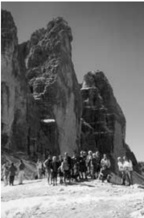
OG Wesseling. An den Nordwänden der „Drei Zinnen“.

Die beiden ersten Wanderungen führten in das benachbarte Städtchen Innichen sowie ins Fischleintal auf gutem Waldweg bis zur Talschlusshütte. Bei der nächsten Wanderung ging es mit der Helmseilbahn hinauf auf 2000 Meter Höhe, wo wir auf zum Teil verschneitem Weg zur Silianer Hütte wanderten. Das Wetter war gut und man hatte eine herrliche Aussicht auf die Sextener Dolomiten.