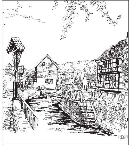
Ortskern an der Olf

Wurden die Dörfer der Eifel vor einigen Jahrzehnten eher noch gemieden, so sind sie heute auch dank des Wettbewerbs „Unser Dorf soll schöner werden“ zu schmucken Anziehungspunkten für Wanderer, Tagestouristen und Urlauber aus dem In- und Ausland geworden. Das einst als Preußisches Sibirien verschrieene Grenzland hat sich von Kopf bis Fuß gemauert und kann sich hierzulande im besten Sinne sehen lassen. Was gestern noch als Verbannungsgebiet für strafversetzte Beamte gefürchtet wurde, ist heute zu einem gelobten Land für jene geworden, die den hohen Wohnwert der Eifeler Dörfer suchen und schätzen. Dafür nimmt man auch gerne in Kauf, 50 oder 100 km bis zur Arbeitsstätte in den Ballungszentren von Rhein und Ruhr zu fahren, um den Traum vom hier noch erschwinglichen Eigenheim wahrzumachen.