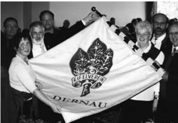
OG Dernau. Das neue „Aushängeschild“ des Dernauer Eifelvereins.

Letzterer stellte fest, dass der Dernauer Eifelverein „Mitverantwortung im Gemeinwesen“ übernimmt und trägt. Ein Wolff-Lob, das auch der Ehrenvorsit-