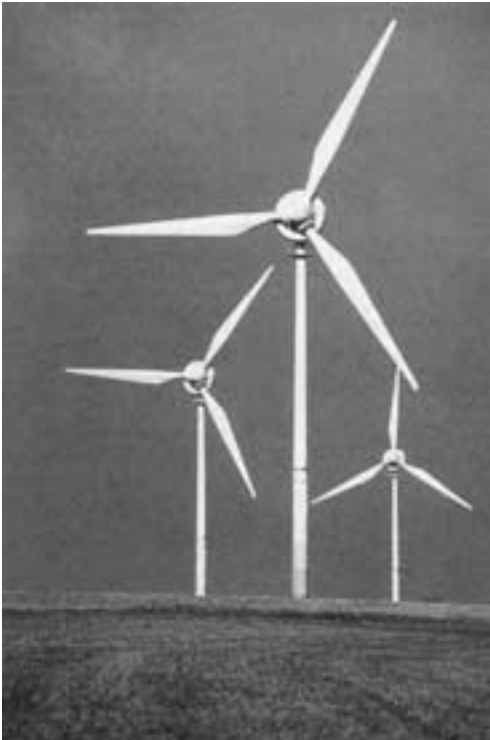
Eifel. Wie Spargel schießen die Windkraftanlagen in den Eifelhimmel.

„Begrüßt und unterstützt werden alle Maßnahmen der Bundesregierung und Landesregierungen sowie kommunaler und privater Einrichtungen, die dazu geeignet sind, im Sinne der Agenda 21 die Nutzung alternativer Energien zu fördern und dazu umweltfreundliche Anlagen bereitzustellen. Bedauert wird allerdings die nach unserer Auffassung einseitige Förderung der Windkraftanlagen. Durch die zur Zeit gängige Subventionspolitik besteht die Gefahr, dass in den kommenden Jahren bevorzugt Windkraftanlagen gebaut werden. Wir befürchten, dass durch diese Entwicklung bereits in naher Zukunft das