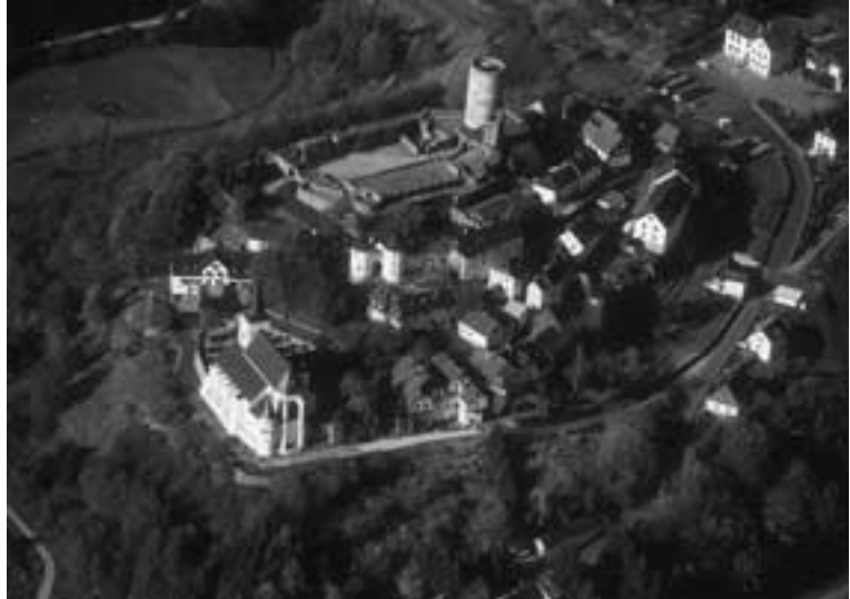
Burg Reifferscheid © Gemeinde Helleenthal

Ein weiterer Schwerpunkt des Ausflugsverkehrs ist seit einigen Jahren das Besucherbergwerk „Grube Wohlfahrt“, wenige Kilometer von Reifferscheid in Richtung Rescheid. Hier wurde bis zum Ende des Ersten Weltkrieges eine der bedeutendsten Erzlagertstätten der Eifel abgebaut. In den besten Jahren waren es täglich 300 Zentner 75 – 80 %-iges Bleierz, das unter schwierigen Bedingungen ans Tageslicht befördert wurde. Endgültig wurde die Grube erst 1940 stillgelegt. Führungen in diesem Besucherbergwerk und im angeschlossenen Museum sind vor allem bei Schulklassen sehr gefragt.