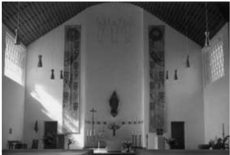
Innenansicht der Pfarrkirche Hellenthal

In der neuen Kirche, die in der Stilperiode der „weißen Architektur“ der 50er-Jahre entstanden ist, wurde bewusst auf eine farbliche Gestaltung des Innenraumes verzichtet. Nach dem Neubau der Orgel (1986) wurden indessen die Schutzflügel des Orgelprospekts, ein Teil der Unterkonstruktion sowie die Emporenbrüstung bemalt. Später kam das gemalte Altarkreuz, dem Hinterrund der dezent gestalteten Altarkonche, hinzu. Insbesondere die kunstvolle Gestaltung der Empore einschließlich der Orgel, die an eine alte, fast in Vergessenheit geratene Tradition anknüpft, gibt der Pfarrkirche St. Anna ihr besonderes Gepräge.