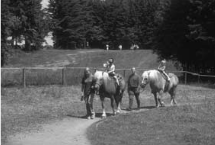
Wildfreigehege Hellenthal