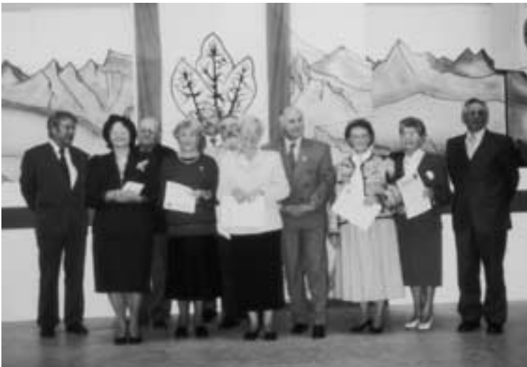
OG Schmidheim. Bei der 75-Jahr-Feier standen auch verschiedene Ehrungen an.

Im zweiten Teil des Programms stand wieder einmal eine Tombola an, deren Reinerlös der Kindergruppe zugute kommen wird. Willy Schuster