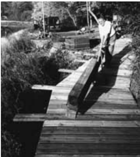
OG Heimbach. Der Weg durch den „Dschungel“ wird erschlossen.