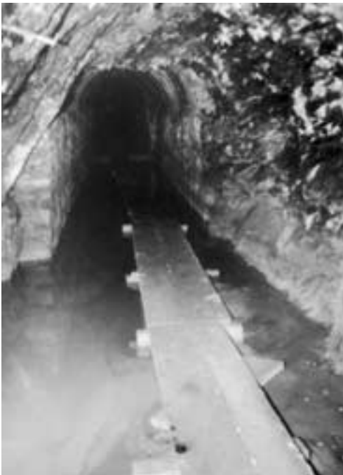
„Tiefer Stollen“ der Grube Wohlfahrt vor den Herrichtungsarbeiten zum Besucherbergwerk

Sehenswert sind auch die Burgen Reifferscheid und Wildenburg, trutzige Zeugen der großen geschichtlichen Vergangenheit Hellenthals, das mit seiner