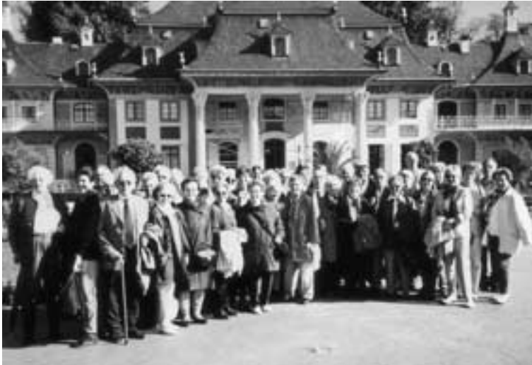
OG Neuss. Station vor dem Lustschlösschen Pillnitz.

und Stufen auf den Burgberg zum gotischen Dom und zur Albrechtsburg.