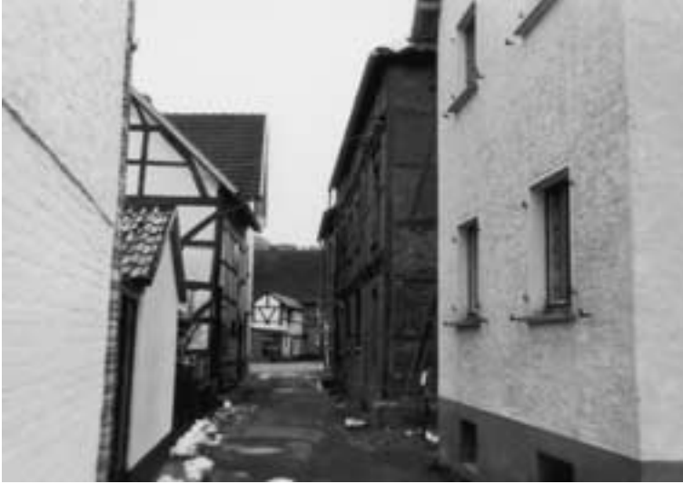
Ehemalige Kirveljass