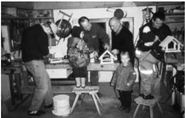
OG Bitburg. Nicht nur die Jüngsten hatten ihren Spaß beim Basteln.