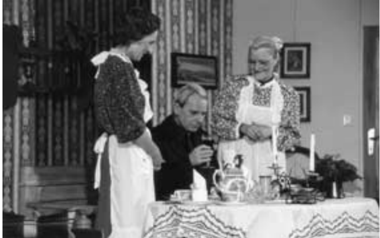
OG Breinig. Mit „Arsen und Spitzenhäubchen“ begeisterten die Laienschauspieler aus Breinig ihr Publikum.

Ohne diese großzügige Unterstützung wäre der Eifer schnell an seine finanziellen Grenzen gestoßen, denn Texte, Kulissen, Kostüme, Saalmiete etc. fordern einiges an finanziellem Aufwand, der erst nach und nach durch wachsende Zuschauerzahlen eingespielt werden konnte. Wir möchten uns daher an dieser Stelle sehr herzlich bei unserer Vereinsführung bedanken; insbesondere dafür, dass sie uns immer volle Gestaltungsfreiheit ließ.