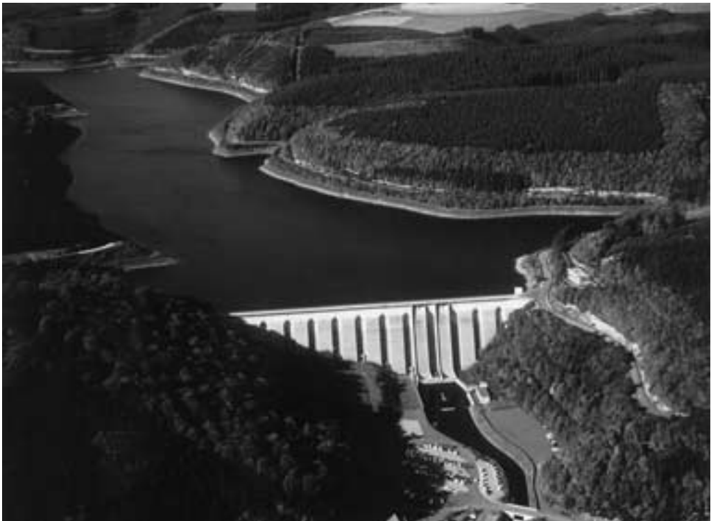
Olefalsperre mit Pfeilerzellenstaumauer

Ein beliebtes Ausflugsziel ist auch das Wildfreigehege Helleenthal mit dem Kinder-Streicheloo und der einzigartigen Greifvogelwarte, wo täglich freifliegende Adler, Bussarde, Milane und Falken die Besucher zu begeistern verstehen. Und wer noch die „Blaue Blume“ sucht: die Jugendherberge Helleenthal zählt zu den populärsten und meistbesuchten Häusern des rheinischen Jugendherbergswesens. Kein Wunder