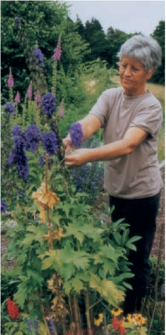
Eifelverein Koblenz: Dauerhafte Pflege und Entwicklung des Bauerngartens am Natur- und Umweltzentrum Koblenz (Waldökostation Remstecken).