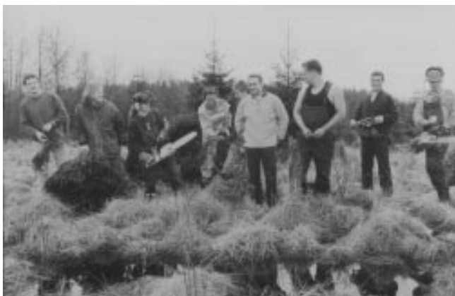
Eifelverein Roetgen: Renaturierungsmaßnahmen im Hohen Venn