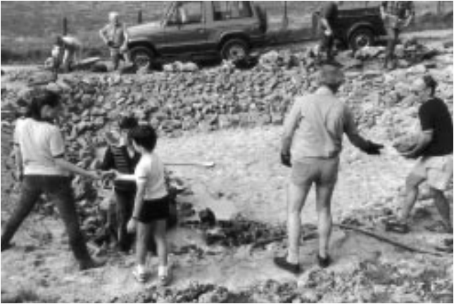
Eifelverein Rott: Anlage eines Amphibiengewässers.