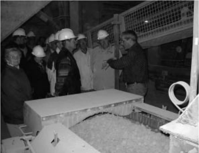
Hillesheim: Auch eine Besichtigung des Wotan-Zementwerkes stand auf dem Programm der Naturschutzwarte-Tagung 2004.