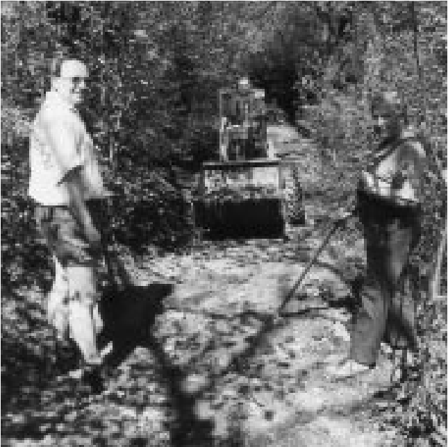
Eifelverein Bleialf: Teilweise ganz schön anstrengend war die Anlage des Naturerlebnispfades „Bleialf-Buchert“ auf dem ehemaligen Bergbaupfad. Hier mussten Mitglieder der OG Bleialf zu schwerem Gerät greifen.