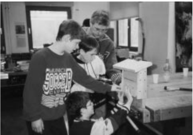
Eifelverein Eschweiler: Das Zimmern von artgerechten Nistkästen will gelernt sein.