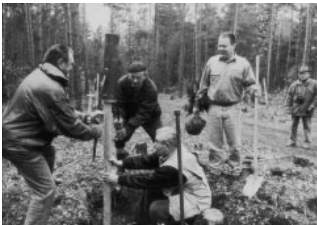
Eifelverein Bad Neuenahr: Auf dem Gebiet am Steckenberg entsteht eine „Allee der Jahresbäume“.