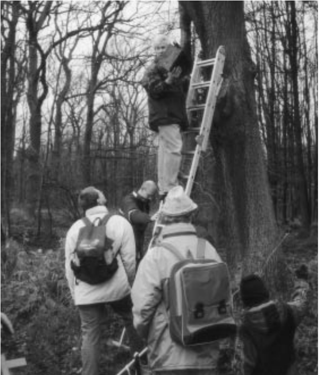
Eifelverein Eschweiler: Aufhängen von Nisthilfen im Bovenberger Wald.