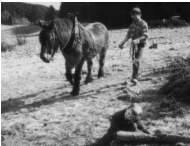
Eifelverein Höfen: Umweltschonende Entfichtungsaktion im NSG „Perlenbach- und Fuhrtsbachtal“.