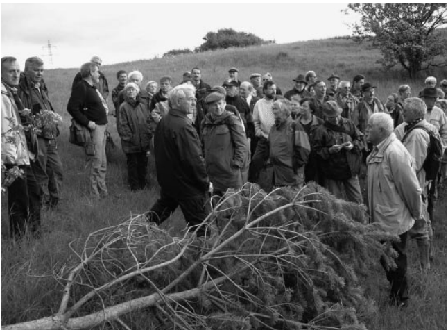
Hillesheim: Das Naturschutzgebiet „Mäuerchen-Hirdenberg“ bei Gönnersdorf war eine Station auf der Tagung der Naturschutzwarte im Jahre 2004.

Grundkenntnisse der Naturschutzgesetzgebung des Bundes und des jeweiligen Bundeslandes sowie der entsprechenden Baugesetze und -verordnungen sollten vorhanden sein oder erworben werden (Selbststudium, „learning by doing“ und/oder Nutzung angebotener Fortbildungsveranstaltungen der LNU in NRW).