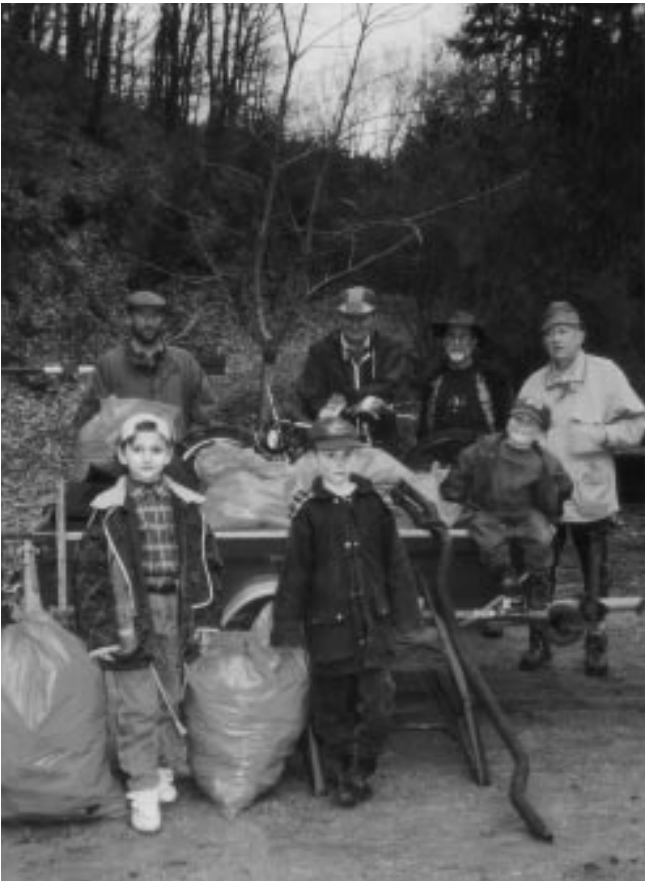
Eifelverein Bad Münstereifel: Der Wald wird gereinigt...

Sämtliche Ortsgruppen sind Preisträger des „Konrad-Schubach-Natur- und Kulturpreises“